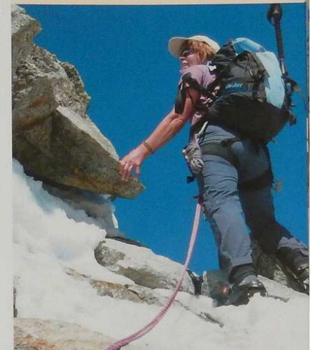
Die Felsbarriere am Hohlaubgrat