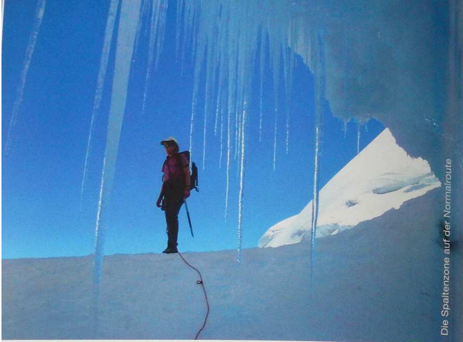
Die Spaltzone auf der Normalroute