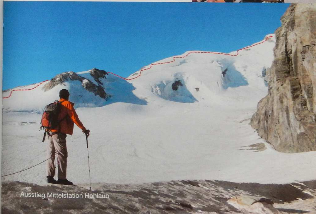
Ausstieg Mittelstation Hohlaub