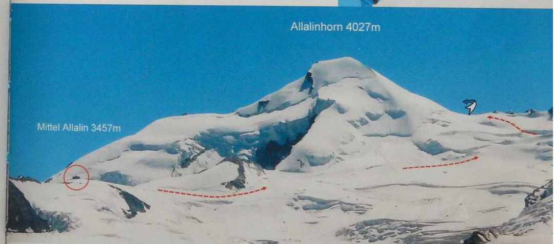
Mittel Allalin 3457m