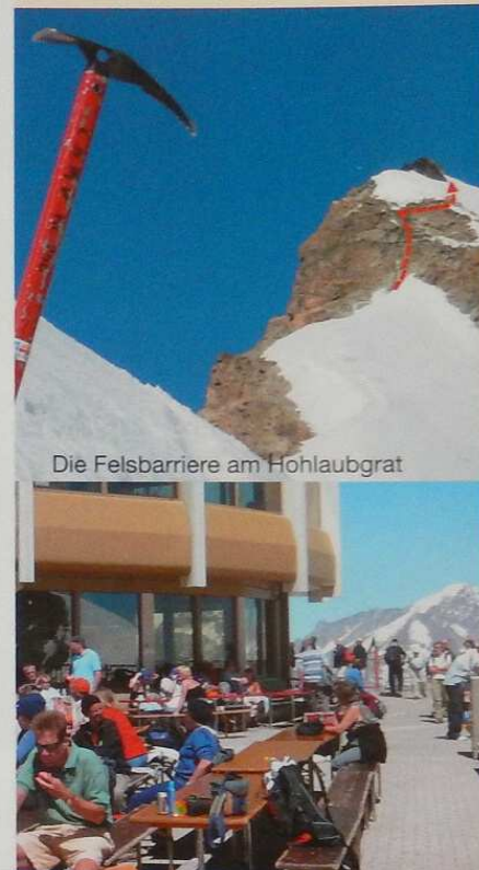
Die Felsbarriere am Hohlaubgrat